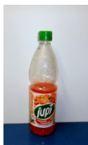
ovocný sirup 2,0