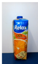
ovocný džus 3,4