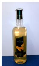
bílé suché víno 3,6