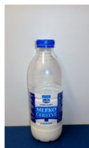
polotučné mléko 6,7