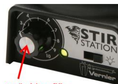
otočný knoflík magnetické míchačky